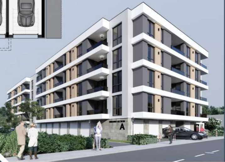
РАЗПРЕДЕЛЕНИЕ ПАРТЕРЕН ЕТАЖ МНОГОФАМИЛНА ЖИЛИЩНА СГРАДА "А"

"SD design" е фирма за архитектурни проектиране и интериорен дизайн, консултантска фирма за Експ. Проект. Бул. "Славейков" №1, София, България. Тел: +359 878 453 300, e-mail: sd_design@abv.bg